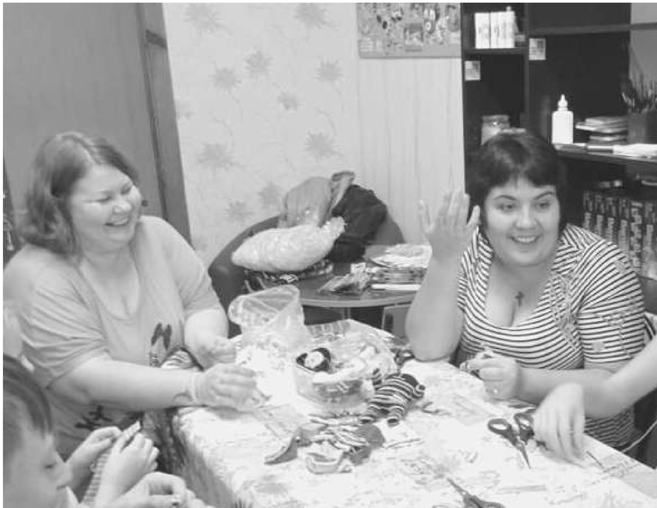
ФОТО ДЛЯ ВДОХНОВЕНИЯ