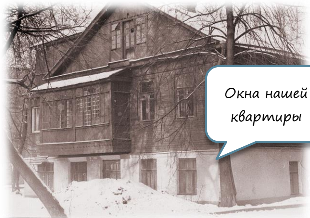
Окна нашей квартиры

В каждом магазине положено иметь уголок покупателя. Обычно он предназначен для всех, но этот уголок – мой собственный. Потому что «Лавка радостей» - не обычный магазин», а я - не обычный покупатель.