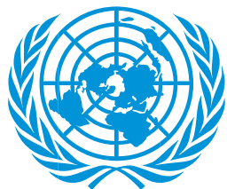
Информационный центр ООН в Москве